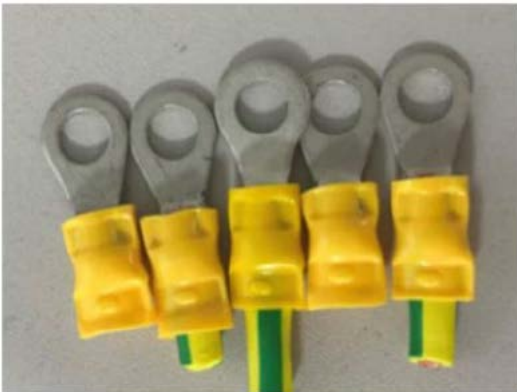
Afbeelding 1 - Omgekeerde krimp