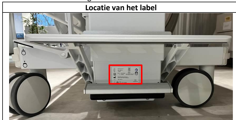
Afbeelding 2. Locatie van het HA FlexTrak-label

Het identificatielabel van de HA FlexTrak bevindt zich aan de handgreepzijde van de transportkar onder het pomppedaal, zoals weergegeven in afbeelding 2.