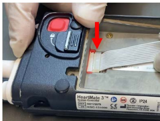
Afbeelding 1: Aansluiting van lintvormig snoer backupbatterij

Bij de bevestigde klachten heeft Abbott corrosie aangetroffen bij het aansluitpunt tussen de systeemcontroller en het lintvormige snoer van de backupbatterij. Dit kan veroorzaakt zijn door overmatig bewegen van het lintvormige snoer tijdens installatie of vervanging van de backupbatterij, specifiek bij de aansluiting van het lintvormige snoer, zie Afbeelding 1.