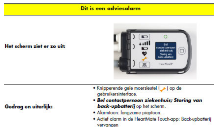
Afbeelding 2: Backupbatterij-alarm, pag. 7-24, Gebruiksaanwijzing voor de arts voor HeartMate 3™ LVAS