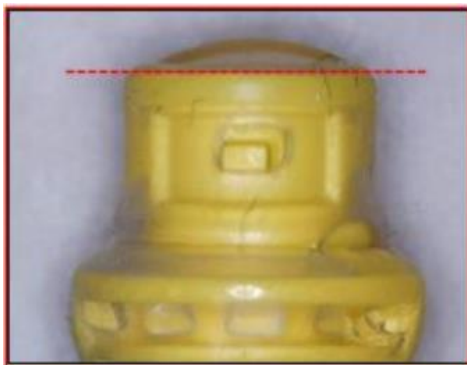
Afbeelding 1: Bolvorming van de siliconen afdichting

ICU Medical heeft batchspecifieke problemen met de siliconen afdichting van de Tego vastgesteld. De waargenomen defecten aan de siliconen afdichting zijn: opbolling van deze siliconen afdichting (zie afbeelding 1). Dit treedt op als gevolg van een te losse siliconen afdichting. Deze afdichting aan de bovenzijde kan uitpuilen of loskomen van de Tego-behuizing en dit kan mogelijk leiden tot lekkage van vloeistof en/of scheuren van de siliconen afdichting (zie afbeelding 2).