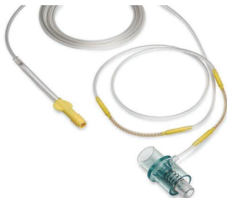
Microstream Advance Neonatal-Infant Intubated CO2 Filter Line