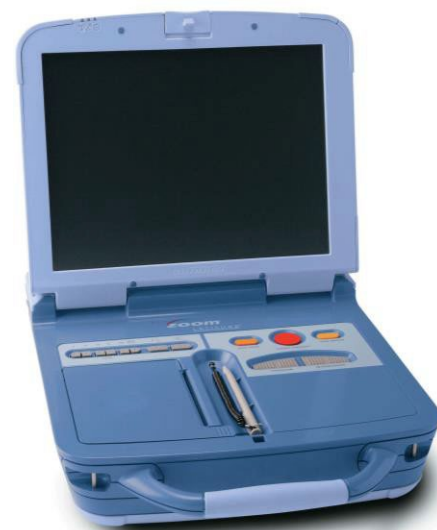
Afbeelding 1. ZOOM-programmer met modelnummer 3120