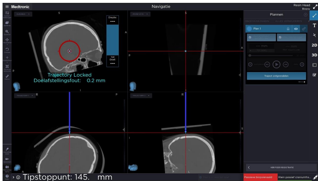
Tip Stop Point (Tipstoppunt) -waarde met ontbrekend teken