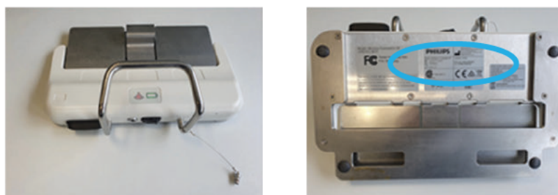
Afbeelding 1: locatie van het label op de onderkant van de voetschakelaar