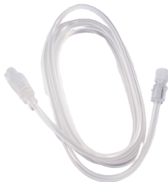
Figuur 1: produkt foto