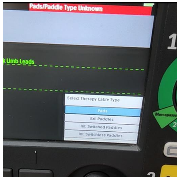
Afbeelding 1: schermweergave van de DFM100 met het probleem van de verkeerde identificatie van de paddles.