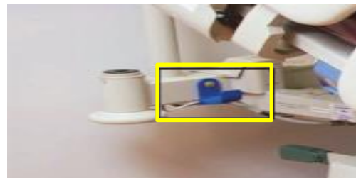
Afb. 1- Compella kabelhaken.

De binnenkant van het frame van het hoofdeinde heeft twee blauwe haken om de stroomkabels op te bergen voor transport. Wikkel de kabels rond de haken zodat ze niet over de vloer slepen. (Afb 1.)