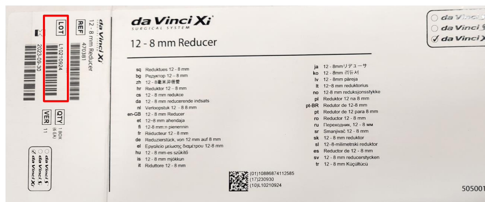
Figuur 3: voorbeeld van de locatie van een lotnummer op het etiket op de binnendoos