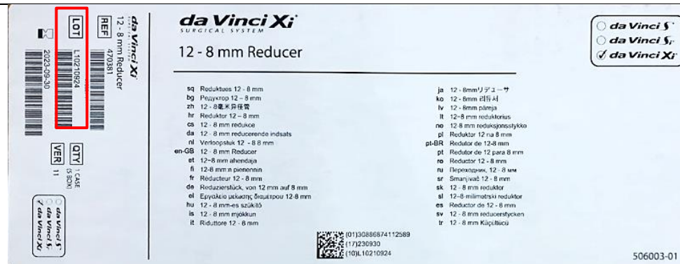
Figuur 2: voorbeeld van de locatie van een partijnummer op de verzenddoos