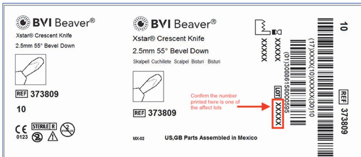
Afbeelding 1, REF 373809 Etiket van doos

Uit onze gegevens blijkt dat u een of meer van de betrokken producten heeft ontvangen. U kunt het betrokken product herkennen door na te gaan of het partijnummer dat op het etiket van het apparaat gedrukt is, een van de getroffen partijen is.