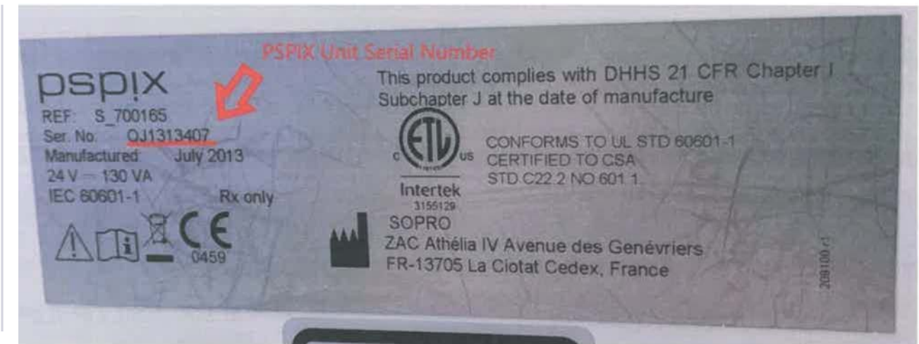
Afbeelding 1: Het serienummer van de /PS-eenheid wordt vermeld op het type/abel achterop de eenheid.

De betreffende !PS-eenheid kan geïdentificeerd worden door het serienummer te raadplegen op het beeldscherm van de scanner of het typelabel achterop de eenheid, zoals getoond in Afbeelding 1.