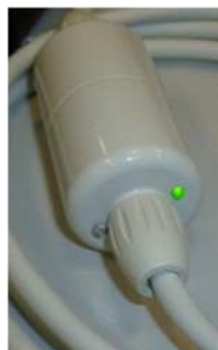
Figuur 1 Groene LED indicatie in gebruik

Gedurende onze post-market surveillance hebben we geconstateerd dat de aansluitlijnen mogelijk worden beïnvloed door een storing die verband houdt met enorme temperatuurschommelingen. De storing kan worden waargenomen omdat de verbindinglijn geen stroom levert en de pomp dus niet oplaadt. Deze fout kan eenvoudig worden opgespoord door de LED-indicatie van de kabel te controleren die aangeeft dat de kabel in gebruik is of niet (zie figuur 1).