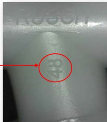
Figuur 1 – Cobb-connector