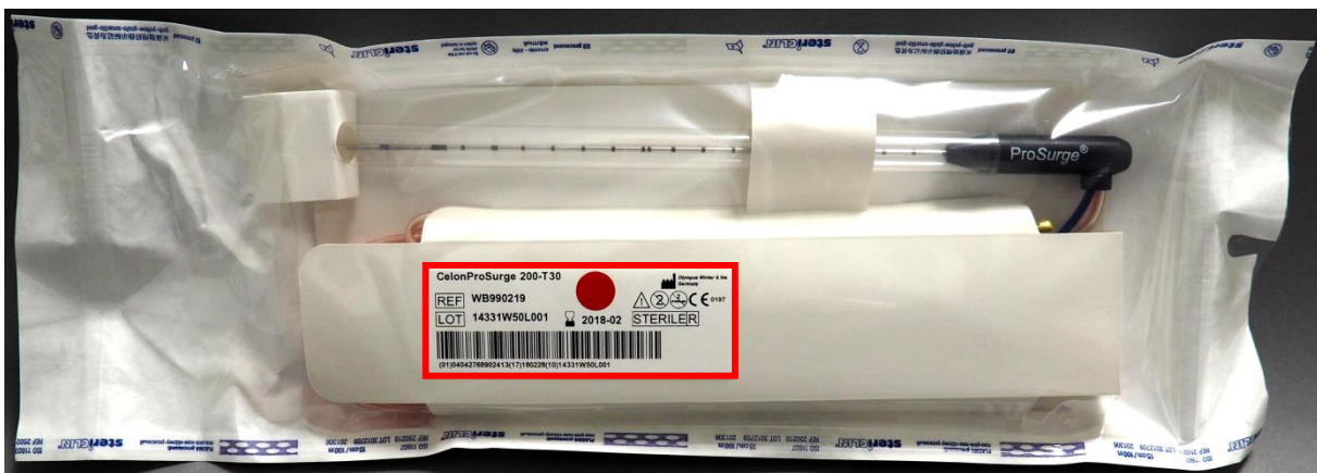
Afbeelding 3: blisterverpakking van de bipolaire applicators