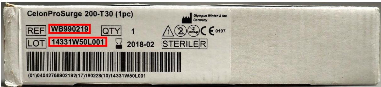
Afbeelding 2: modelnummer (REF) en lotnummer (LOT) op het label van de buitenverpakking (zijaanzicht)