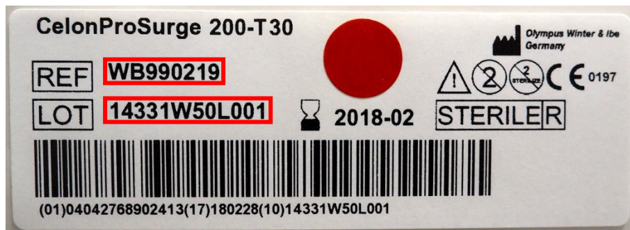
Afbeelding 4: modelnummer (REF) en lotnummer (LOT) op het label van de blisterverpakking