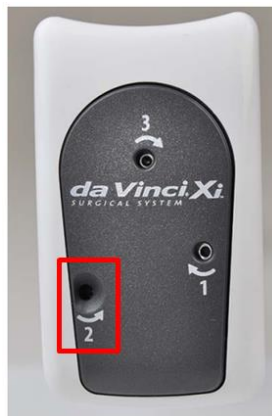
Afbeelding 2: vrijgavegat 2 van het Stapler-instrument "open" zonder witte markering

In situaties waarin vrijgavegat 2 niet door de witte markering wordt afgedekt (afbeelding 2), hoeft het gereedschap niet in vrijgavegat 1 te worden gedraaid. Wanneer toch wordt geprobeerd het instrument in vrijgavegat 1 te draaien, kan het instrument breken waardoor het onbruikbaar wordt.