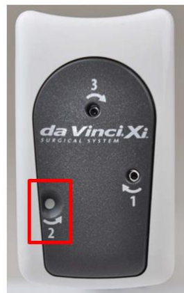
Afbeelding 1: vrijgavegat 2 van het Stapler-instrument "afgesloten" door witte markering

In situaties waarin vrijgavegat 2 door een witte markering wordt bedekt (afbeelding 1) en niet toegankelijk is, moet de SRK in de vrijgavegaten 1, 2 en 3 worden geroteerd.