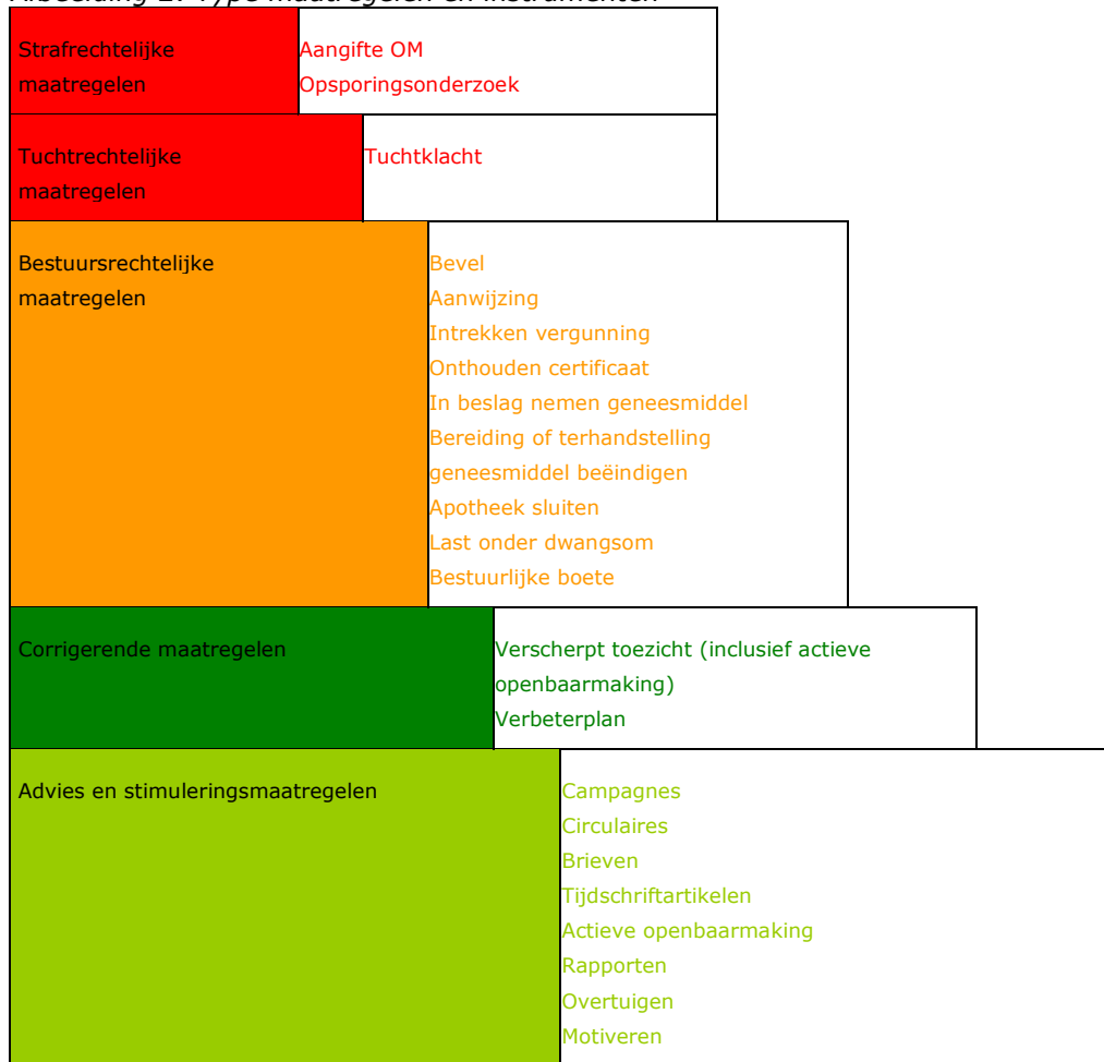
Afbeelding 2: Type maatregelen en instrumenten

De kleuren van de maatregelen en instrumenten en de getraptheid van de afbeelding corresponderen met de zwaarte en proportionaliteit ervan (zie ook § 3.3 en afbeelding 3). De getraptheid van de afbeelding impliceert geen volgorde van maatregelen. Een corrigerende maatregel gaat bijvoorbeeld niet vanzelfsprekend vooraf aan een bestuursrechtelijke of tuchtrechtelijke maatregel. De inspectie hanteert het uitgangspunt van het kabinetsstandpunt op de kaderstellende visie op toezicht: zacht waar het kan, hard waar het moet. Dat kan betekenen dat de inspectie ook bij eerste overtreding al naar gelang de ernst van de situatie naar het zwaarste instrument grijpt. Bij de keuze van de maatregel speelt de effectiviteit ervan op korte en op langere termijn een rol. Actieve openbaarmaking is een stimulerende maatregel die ook een corrigerende werking kan hebben.